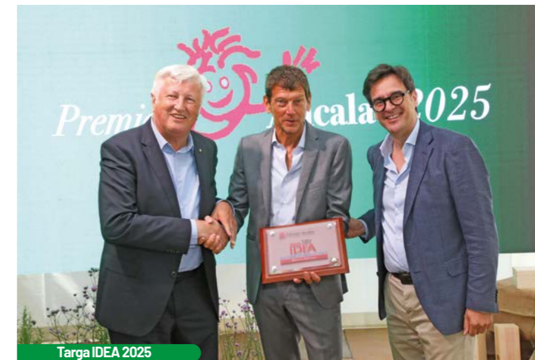
Targa IDEA 2025

biamo fatto crescere le aziende, aperto nuove sedi, investito in innovazione e in nuovi stabilimenti. Ma soprattutto abbiamo mantenuto vivi i valori con cui lui aveva iniziato».